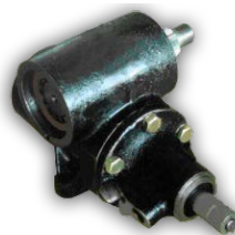
Механизм рулевой с гидроусилителем для автомобилей УАЗ