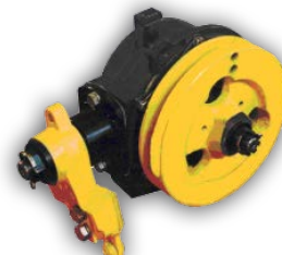
Механизм качающейся шайбы

Общество с ограниченной ответственностью Концерн «Инмаш»